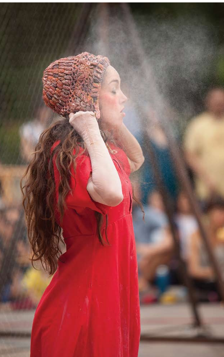
*Festival de payasas CircCric