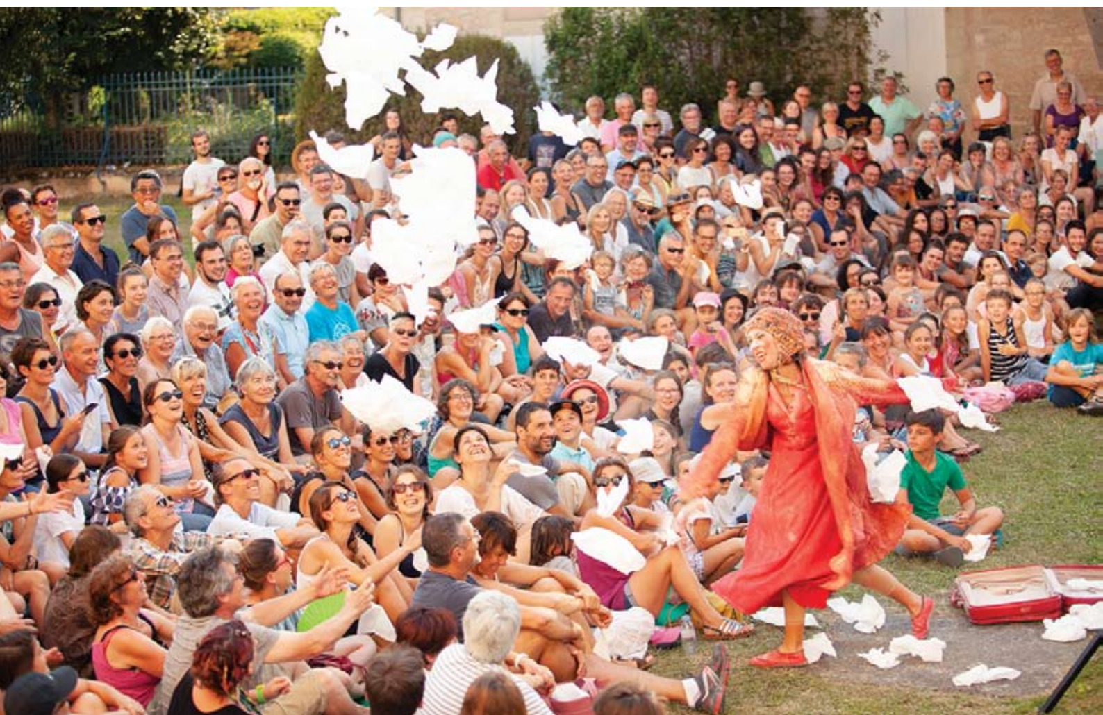
*Festival Mimos, Perigueux (Francia)

ROJO lleva su segunda temporada en 2018 girando por festivales y circuitos muy diversos (Kaldearte, Entrepayasas, Iberescena, Circaire, Festival de Payasas del Circ Cric, Mimos, Cucha Primavera, Ciudad Distrito, Matadero de Madrid, Festival Contemporáneo de Lazarillo, Centro Cultural Pilar Miró, Festa del Prat Solidari, Minipop, FestiClown, Veranea Tetuán y Muestra de Teatro Cómico de Cangas entre otros).