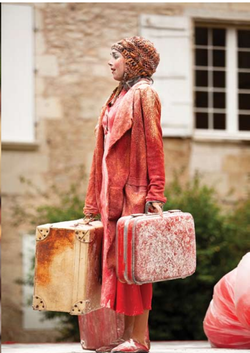
*Festival Mimos, Perigueux (Francia)