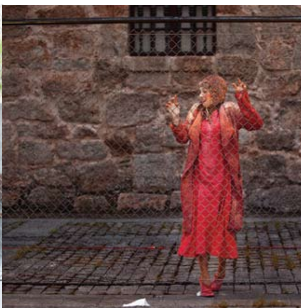
*Escenario Vivo, La Rioja.